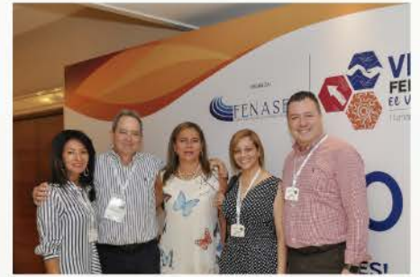
VII CONGRESO INTERNACIONAL 2019