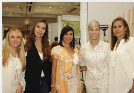
VII CONGRESO INTERNACIONAL 2019