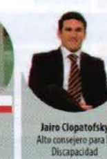
Jairo Clapatofsky Alta consejero para la Discapacidad