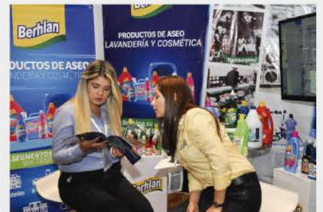
VII CONGRESO INTERNACIONAL 2019