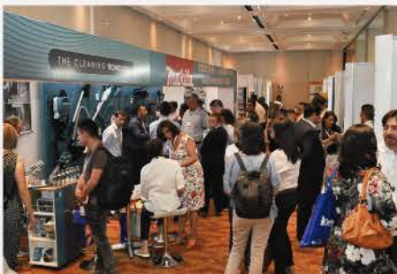
VII CONGRESO INTERNACIONAL 2019