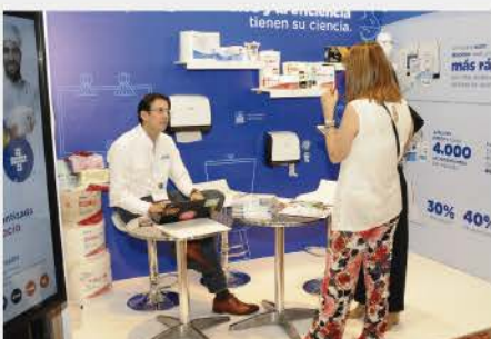
VII CONGRESO INTERNACIONAL 2019