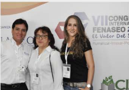
VII CONGRESO INTERNACIONAL 2019