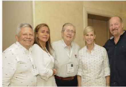
VII CONGRESO INTERNACIONAL 2019