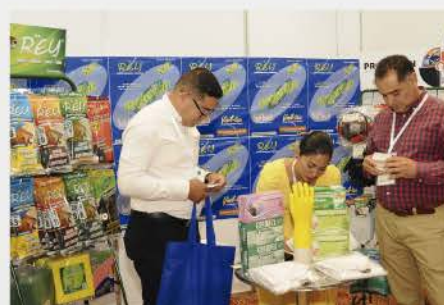
VII CONGRESO INTERNACIONAL 2019