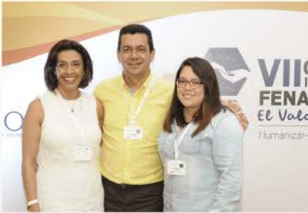
VII CONGRESO INTERNACIONAL 2019