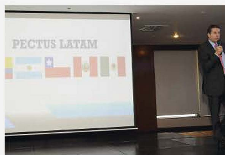
VII CONGRESO INTERNACIONAL 2019