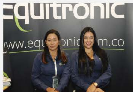
VII CONGRESO INTERNACIONAL 2019