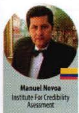
Manuel Novoa Institute For Credibility Assessment