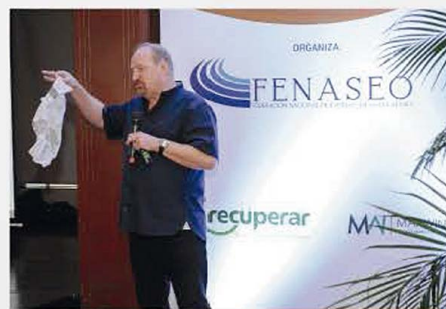
VII CONGRESO INTERNACIONAL 2019