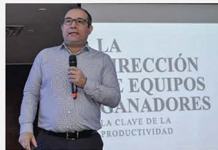
VII CONGRESO INTERNACIONAL 2019