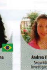
Andrea Yanes Seguridad e Investigaciones