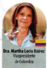
Dra. Martha Lucia Rairez Vicepresidente de Colombia

PROFESIONALES QUE SE DESEMPEÑAN EN EL CAMPO LABORAL COMO FUNCIONARIOS, EMPRESARIOS O EMPRENDEDORES. IGUALMENTE, ESTUDIANTES DE SEGURIDAD, ADMINISTRACIÓN O AFINES."