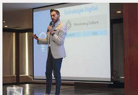
VII CONGRESO INTERNACIONAL 2019