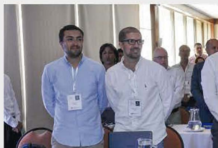
VII CONGRESO INTERNACIONAL 2019

Descargue aquí Su certificado de asistencia: