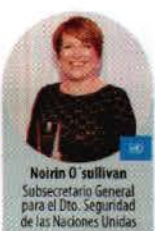
Noirin O'Sullivan Subsecretario General para el Dto. Seguridad de las Naciones Unidas