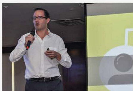
VII CONGRESO INTERNACIONAL 2019

Agradecemos a cada uno de nuestros conferencistas por su compromiso e impecable presentación.