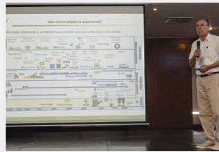
VII CONGRESO INTERNACIONAL 2019